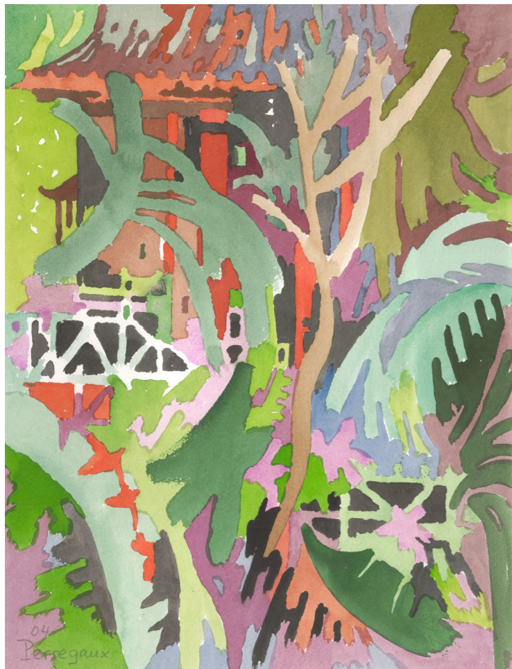
Aloys Perregaux * 1938 «Dans le Seyon à la Borcarderie», aquarelle, 35x47, 2022 «Bali, la barrière blanche», aquarelle, 40x30, 2004